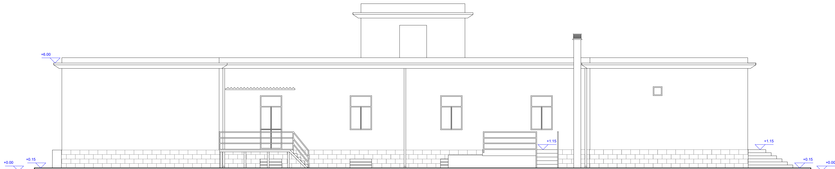
Fabbricato A, edificio uffici - Prospetto Sud - Ovest